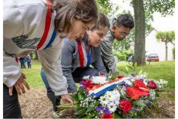
10 mai : Journée nationale de l'abolition de l'esclavage.