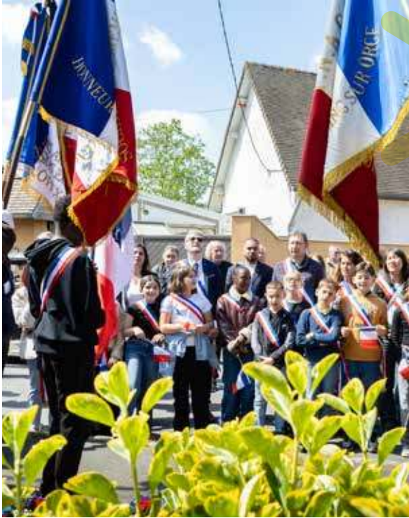
8 mai : commémoration de la Victoire de 1945.